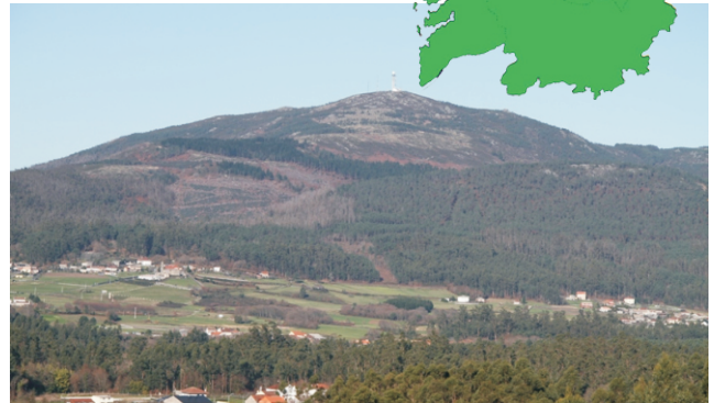
Vista sur do Xesteiras