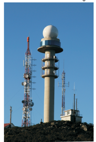
Estación de radar de Meteogalicia