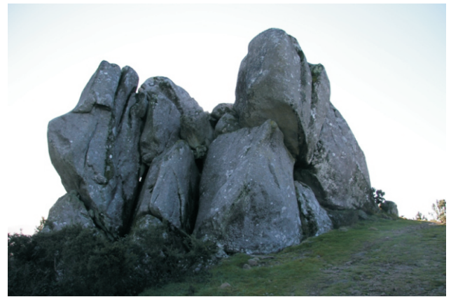
Pedra da Águia

O monte Xesteiras é un cume de 716 m de altura que se ergue illado entre os concellos de Cuntis e Valga, separando a Depresión Meridiana da falla de Cuntis. Ten unhas excelentes vistas de todo o contorno, desde a Ría de Arousa ata as serras da Dorsal.