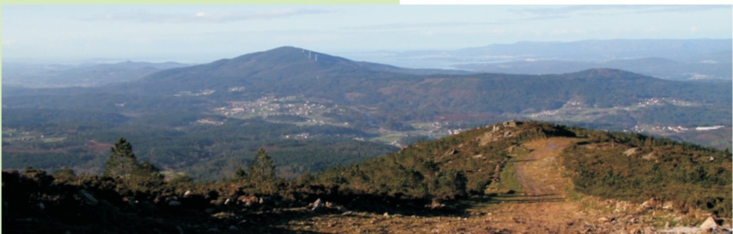
A Depresión Meridiana, o Xiabre a a ría de Arousa desde o cume do Xesteiras.