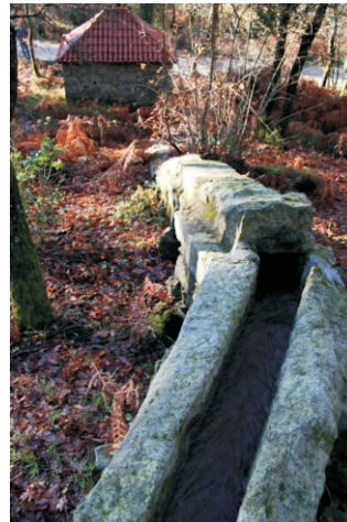
Muíños de Magán

Na estrada de Valga a Caldas de Reis, a 7,5 km, cóllese o cruce que vai de O Pino a Cuntis e á altura do km 1,3 un cruce á esquerda que vai dar a unha pista forestal que chega ata o cume do Xesteiras. Outras pistas soben desde Magán, desde Gontade ou A Portela (Cuntis-A Estrada).